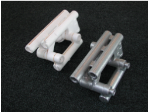
figuur 7.3 product t.b.v. CV-industrie, links het schuimmodel, rechts het gietstuk.

Bij de lost foam technologie worden producten gegoten met behulp van schuimmodellen. Het schuimmodel wordt in een vormkast ingebed in los zand, dat door trillen wordt verdicht. Vervolgens wordt via een giertrechter vloeibaar metaal op het schuim gegoten. Onder invloed van de hoge temperatuur vergast het schuimmodel. Zodra het metaal gestold is, kan het product makkelijk uit de vormkast verwijderd worden. Met de lost foam technologie is het in principe mogelijk zeer complexe producten in één keer te gieten, omdat het schuimmodel uit verschillende delen kan worden opgebouwd. Wel is voor ieder product een nieuw schuimmodel nodig.